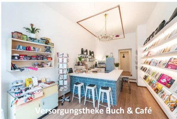
Versorgungstheke Buch & Café