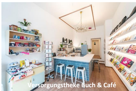
Versorgungstheke Buch & Café