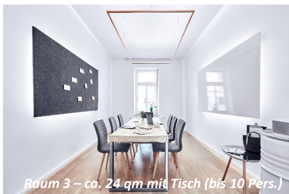
Raum 3 – ca. 24 qm mit Tisch (bis 10 Pers.)