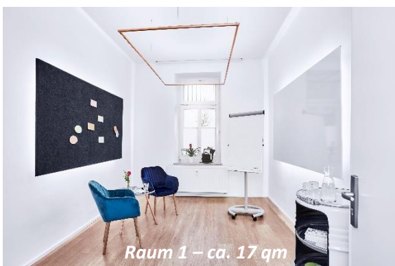
Raum 1 – ca. 17 qm