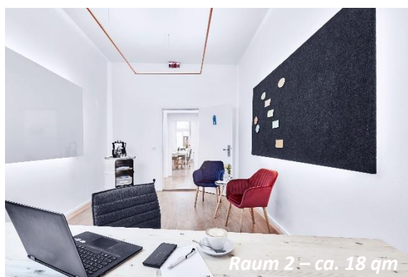
Raum 2 – ca. 18 qm