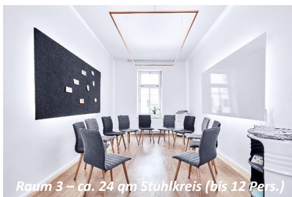
Raum 3 – ca. 24 qm Stuhlkreis (bis 12 Pers.)