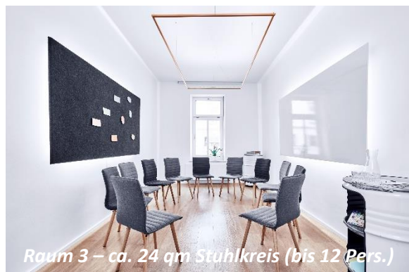
Raum 3 – ca. 24 qm Stuhlkreis (bis 12 Pers.)