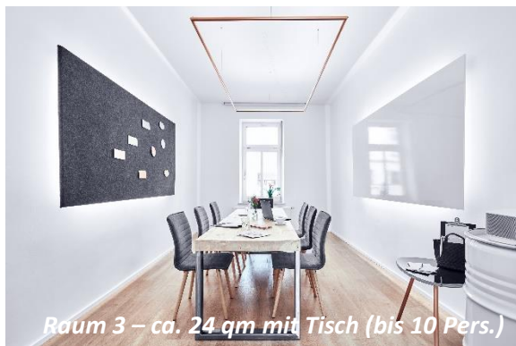
Raum 3 – ca. 24 qm mit Tisch (bis 10 Pers.)