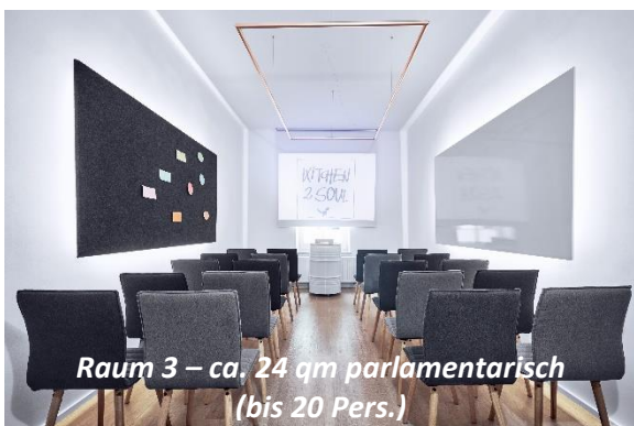
Raum 3 – ca. 24 qm parlamentarisch (bis 20 Pers.)