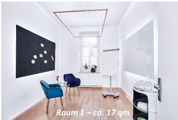
Raum 1 – ca. 17 qm