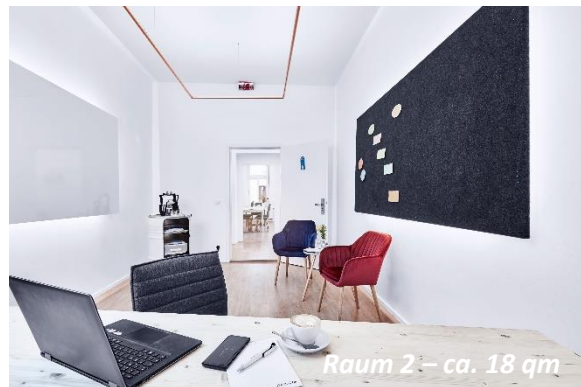
Raum 2 – ca. 18 qm